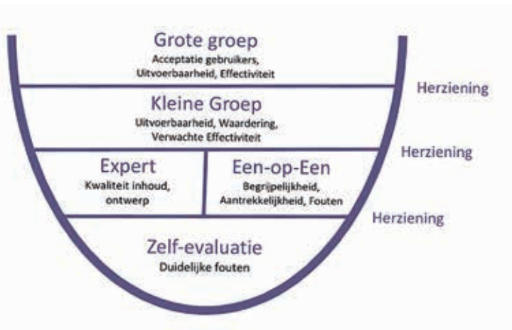
▲ Figuur 2. Stappen in de evaluatiefase (vertaald uit Educational Design Research, Plomp & Nieveen, 2013)

van kwaliteitszorg. Oftewel onderzoekmatig onderwijs (door)ontwikkelen.